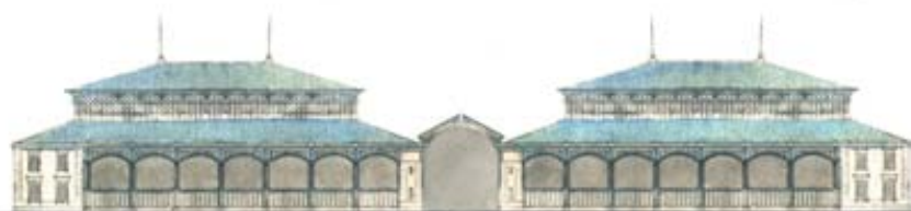
Le marché Esquirol: démonté en 1892, il aurait été remonté à Lourdes.

Le projet Maguès avait tracé un axe reliant l'angle nord-est de la place des Carmes au Grand Rond. La municipalité préfère un autre tracé, plus large L et débouchant sur les allées.