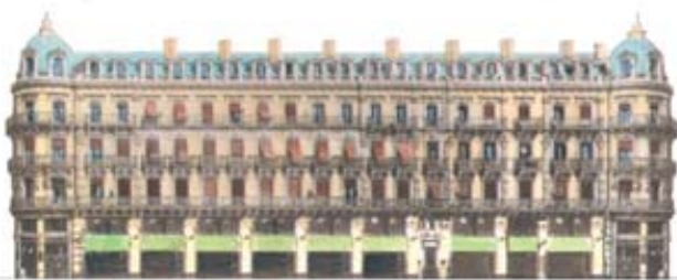
Le bazar Labit construit en 1877, en face du Capitole, premier des grands magasins de Toulouse.

Toulouse qui, pour la première fois depuis des siècles, voit sa population fortement augmenter (+72% entre 1842 et 1856), semble sortir de son isolement. Le canal latéral à la Garonne arrive en 1856, le train en 1857, le trafic augmente sur les nationales qui viennent buter sur la vieille ville et son labyrinthe de ruelles. (Suite page 42).